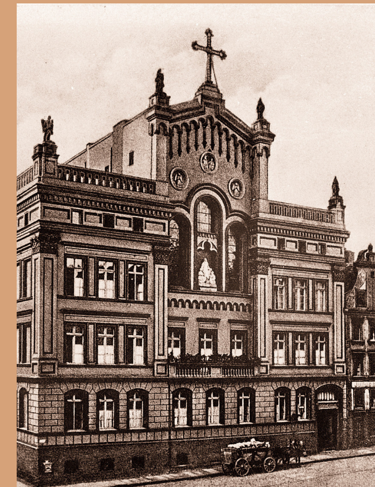
Dům sv. Alžběty v Nise