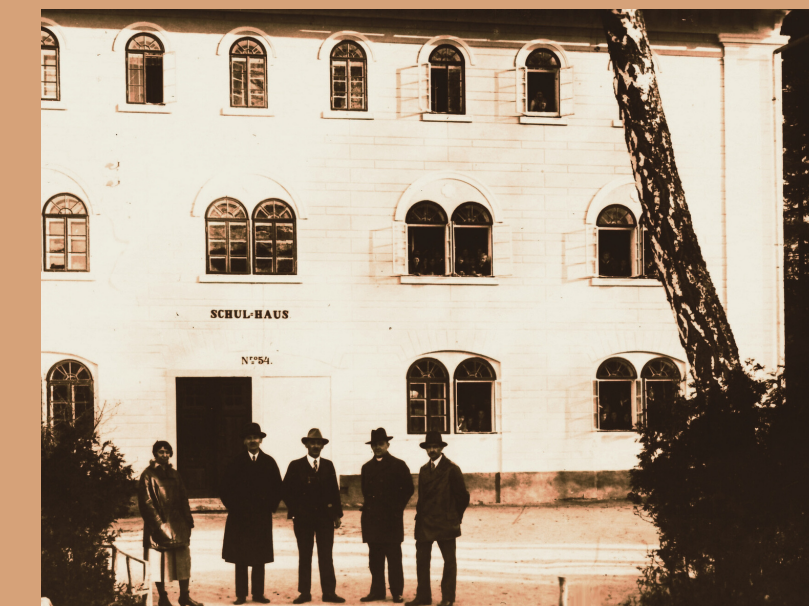
Škola Štětínov - Sobotín