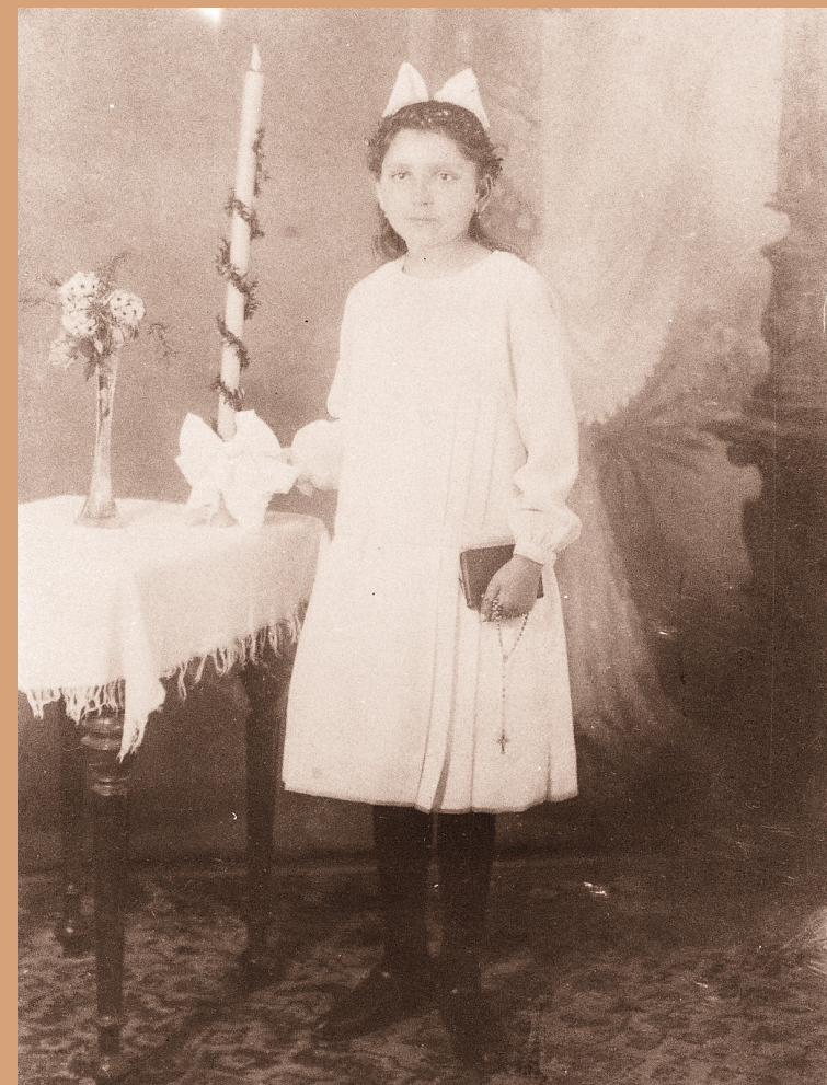
1. svaté přijímání