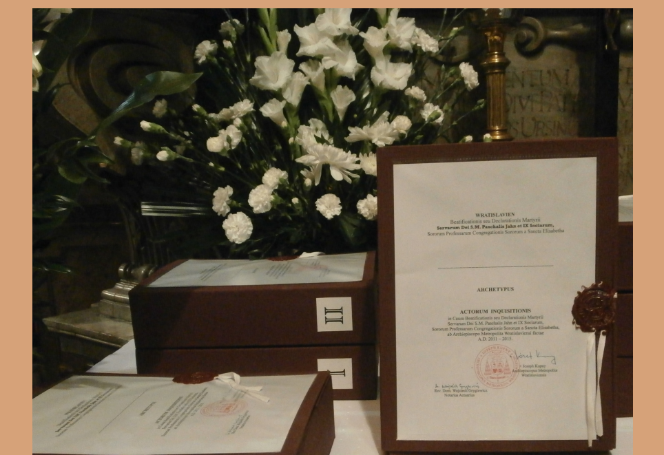
Zapečetěné beatifikační dokumenty